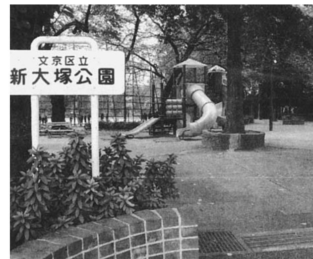
住民が存続を求めて運動している新大塚公園

昨年12月、教育委員会は、五中・七中統合校の運動場については、七中の跡地にすると決定。新大塚公園のグラウンドは兼用工作物としないことを明らかにしました。(詳細は二面の関連記事参照)