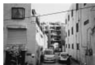
小石川5-39「連担建築物設計制度」マンション計画地

算議会で「環境悪化を許すな」と区に迫りました。区は「自治基本条例にある『企業の社会的責任』に基づく話し合いを指導する」と答弁しました。