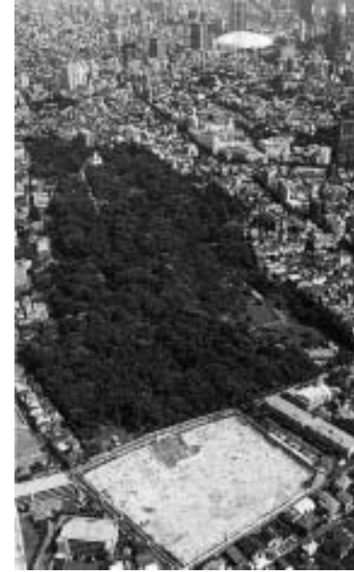
井戸水の行方が心配されている小石川植物園。手前の更地部分がマンション予定地(千石2丁目)

8月9日、大会終了後、私は妻と「千羽鶴」を平和祈念像に捧げてきました。蓮田の実家に立ち寄った私に「元気そうで安心したよ」と母が手渡した「千羽鶴」。体調を崩した息子の健康回復の願いが込められた「千羽鶴」に、長崎で平和のメッセンジャーの努めを託したのです。