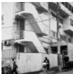
久堅保育園(改修前)

新行革素案で区は、久堅保育園(小石川5)まで民間に委託すると発表。「なぜ区立保育園まで民営化なの？」子育てへの不安と怒りの声があがっています。