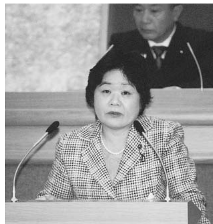
本会議質問する関川区議 (内容は4面へ)