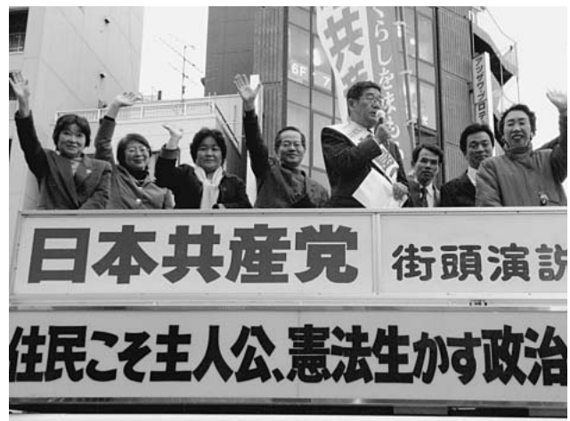
日本共産党 街頭演説 住民こそ主人公、憲法生かす政治