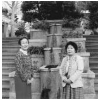
元町公園にて小竹都議とともに

文京区に在住する、3人以上の子どもの扶養する世帯に対し、区立保育園等に通う第3子以降の保育料が無料になります。また、特定不妊治療費助成事業も始まります。