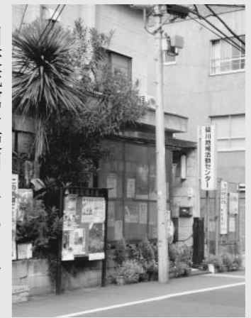
老朽化も進む礪川地域活動センター

川交流館を使用しているみなさんの声です。かといって遠くの施設を使うのも不便です。地域活動センターをもっと区民に開放してくれないかと、要望しました。区は「今後代替を含めて検討している」とのことですが、当面、センターの有効利用が求められています。気軽に打合せなどできるスペースとして利用を、そんな思いを届けていきます。