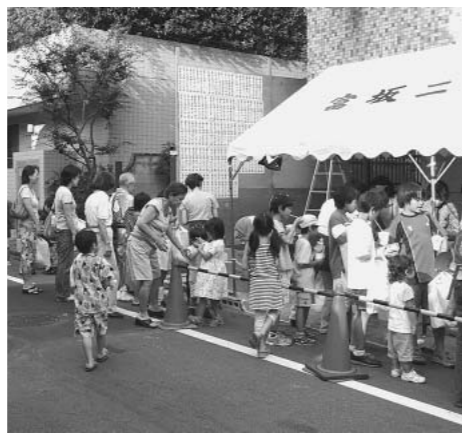
秋の「子どもまつり」。子どもたちが増えているのを実感します。

■「後期高齢者医療制度」の撤回を 来年4月からの75歳以上の新たな高齢者医療制度は、高すぎる保険料（東京都の試算では平均11万5千円）、「差別医療」の持ち込みなど、問題だらけです。 政府も、国民の「今でも大変なのに、これでは安心して医者にかかれない」の声に『見直し』を言い始めましたが、問題の先送りでは解決になりません。全国の200を超える自治体から見直しの意見書があがっています。区議団の来年度予算要望では、中止・撤回を国に求めました。