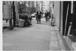
斜めになった歩道 = 小石川2丁目

高齢者や障がいをもつ方々にやさしい街づくりが求められています。区役所から水川下に向かう千川通りは、以前から歩道の傾斜が指摘されています。構造の問題がありますが何とかならないものか：改めて議会で取り上げました。 また白山通りの街灯を明るくするとりくみも進み始めています。ひきつづき区に要請していきます。