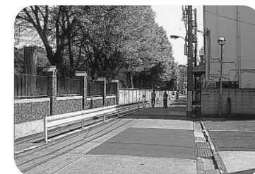
手前が改修済の塀 その先が改修予定

降3か年で行う計画です。06年2月に区議団が要望しているように、全周にわたって景観にマッチした、植物園の中が見渡せる塀改修になるよう、さらに頑張ります。