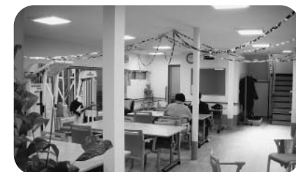
新装なった いきいき西原

千石4丁目の旧西原寿会館が、ようやく介護施設のデイサービスセンターとして、3月オープンしました。2階は、全面的に地域に貸し出されます。道路から見える標識を要望中。