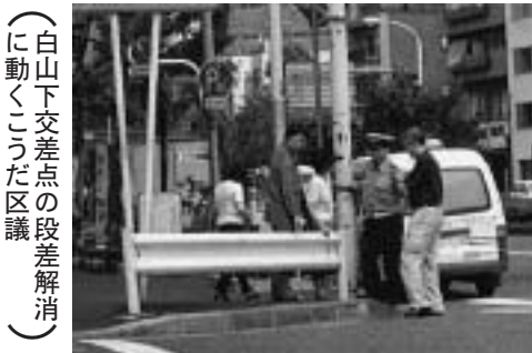
(白山下交差点の段差解消に動くこうだ区議)

現在、音羽の文京福祉センター内で行われている通所更生施設が狭くなっていることから一部移動するものです。二〇〇四年四月から開設される予定です。 区内五番目 特養老人ホーム実現 文京区内五番目の特養老人ホームが湯島に「(仮称)特別養護老人ホームゆしま」として建設されることになりました。社会福祉法人東六会が建設し、ベット数は約百床の予定です。