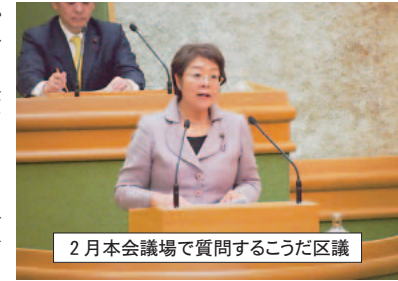
2月本会議場で質問するこうだ区議

「保育所落ちたの私だ」と大問題になっていますが、それに先駆ける2月、文京区の保育の現状について質問しました。 「保育の質」の担保については、区は東京都の補助金を活用した第三者評価を求めるとしたものの、実績は明らかでなく義務化もされていません。民間の保育所で働く職員の大量退職や職員不足の原因である、給与・処遇の改善については「一義的には事業者の責任において実施されるもの」とし、区は責任を回避しました。 保育所に支給される都補助金による処遇改善策で、何人がいくら昇給したのか、区の保育士と比較して私立の保育士給与は何%かとの質問にも、把握していないという答弁です。 文京区では、2月発表の認可保育所入所「不承諾」が768人に及ぶ深刻な事態で、保育所不足と保育の質の問題は、政府の「官から民へ」の誘導策（裏面参照）で起きた事態であり、国と区の責任で早急な対策を講じることを強く求めました。