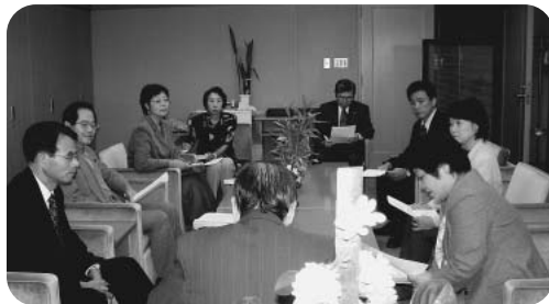
区に元町公園保存を 申し入れる日本共産 党区議団ら

5月からシビック5階に「障害者就労支援センター」が開設。通所施設の食費補助。応益負担撤廃を要求。