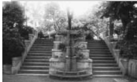
「日本の歴史公園100選」にも選ばれた元町公園

元町公園に湯島総合体育館を移設する計画に、区民や造園学会などから、「元町公園は関東大震災の復興小公園のうち唯一、当時の構成を保