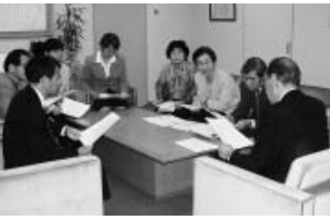
申し入れする小竹前都議と日本共産党区議団

少人数学級を実施している山形県では、児童の88%が「友だちが増えた」、80%の校長先生が「学級のまとまりを感じる」と言っています。「40人学級」に固執する都の姿勢を変えるために全力をあげます。