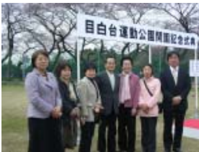
防災公園として貯水槽や防災倉庫も完備されています。