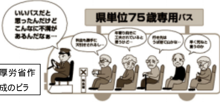
厚労省作成のピラ

《このニュースは区議団ホームページ http://www.jcp-bunkyojugidan.gr.jp/ でもご覧いただけます》