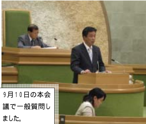
9月10日の本会議で一般質問しました。

《このニュースは区議団ホームページ http://www.jcp-bunkyojugidan.gr.jp/ でもご覧いただけます》