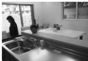
エルムンド小石川居間