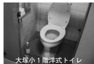
大塚小1階洋式トイレ