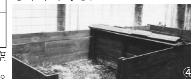
落ち葉堆肥を止めている学校 ①窪町小学校 ②大塚小学校 ③林町小学校 ④青柳小学校 ⑤第十中学校

○この日測定した落ち葉堆肥の堆積周辺の空中線量は地表5cmで、0.22μSv/hでした。