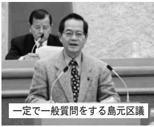
一定で一般質問をする島元区議