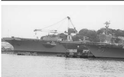
原子力空母ジョージワシントン(横須賀)