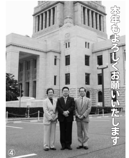
本年も早くくは願っています