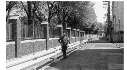
小石川植物園西門付近

東大と文京区の基本協定をうけ、今後6年計画('10~'15年)で、万年塀の西側、南側部分890mの改修と遊歩道・区道整備が始まります。遊歩道幅計画は表の通りです。万年塀のデザインは東大がコンペを開き選考します。本年1月早々には地元説