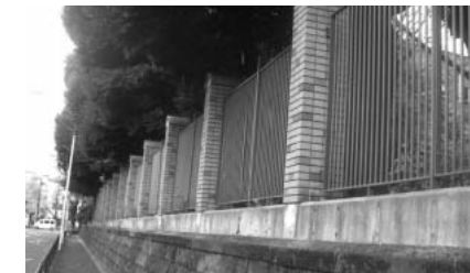
東大弥生門付近(改修モデル)