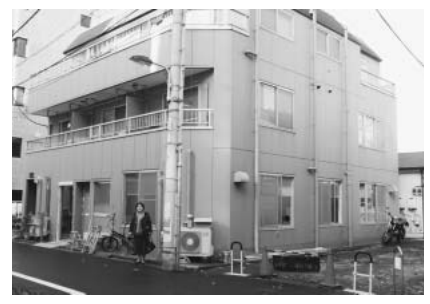
たんぼぼ保育園第2分園前にて

ぼ保育園の第2分園が弓町教会近くに、23年には本郷地域に90人規模の私立認可園が開設されます。日本共産党は、本会議質問や文教委員会などで、待機児童の解決を一刻も早く行うよう再三求めてきました。