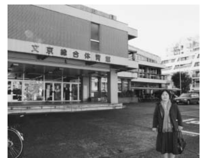
文京総合体育館前にて

区民の運動と、関川区議も頑張り旧4中跡地は、総合体育館が2013年3月完成予定で計画がすすめられています。現在の総合体育館の跡地は、今後どのように使われるかは未定でしたが、昨年の第4回定例会で、教育センター・福祉センターの建て替えの候補地として、急遽浮上しました。