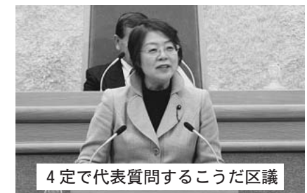
4定で代表質問するこうだ区議

日本共産党は、都内の学校の状況、他県の少人数学級の成果なども詳しく調べ、1992年以來くりかえし実施を求めてきました。