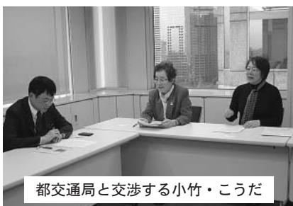
都交通局と交渉する小竹・こうだ 区に貸借の打診があったもので、現在、都と調整中です。