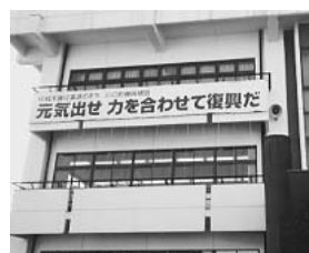
11月3日 新潟県川口町 震災復興について視察