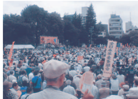
怒りの国民大集会 (6/23 明治公園)

げない」との自らの公約も破るもので、許せません。また3党合意で、社会保障の基本的理念を投げすて、医療や年金、介護、生活保護などの各分野に「自己責任」をもちこみ、社会保障の解体をすすめようとしています。くらしも日本経済