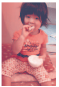
子どもは大人より放射線の感受性が4～5倍高く特設の配慮が必要です。

給食を提供する小中学校・幼稚園・保育園・福祉センター全68カ所を6グループに分け1年間かけ、1グループずつ6回測定を実施する文京区。かかる費用は総額で100万円程度です。これまで溜め込んだ税金をつかって1カ月に1回、年11回程度の測定を行うべきです。