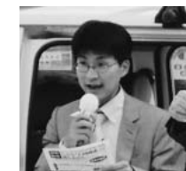
東大前・千駄木・根津の各駅で定期的に区政報告をしています

景観審議会（12/13開催）は「下町情緒が色濃く残る」根津2丁目の住宅街（不忍通り沿道除く）を景観形成重点地区に選定しました。審議会資料は「下町らしさを象徴する風情ある建物が点在している」と指摘しています。根津神社がある根津をはじめ千駄木・弥生・向丘・白山の地域性を生かしたまちづくりのためにも、木造住宅耐震改修助成制度の利用を進めるとともに絶対高さ制限による高層建築の誘導を防止することが必要ではないかと思えます。