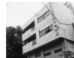
地震研やお寺の緑に近接するアカデミー向丘

建設中の六中校舎に向丘地域活動センターとアカデミー向丘が併設されます。この二つの施設・敷地の今後の活用方法について区が意見募集をしています。区は今後、予定している向丘保育園、育成室の耐震化工事中の代替園舎として使用した後、「向丘地活⇒高齢者福祉施設」「アカデミー向丘⇒創業支援施設」という方向性を示していますが、「向丘に図書館を」という長年に渡る要望があることも踏まえて検討を行うべきだと思います。