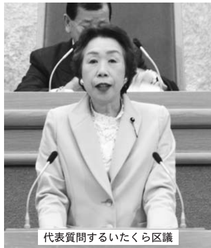
代表質問するいたくら区議