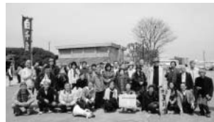
ら撤退させる闘いが重要と強く思いました。

原子力空母ジョージワシントンが母港としている横須賀基地を海上から見学。日米安保の下、戦後65年間基地あるがゆえに事件・事故が日常茶飯事化している話を聞き、横須賀を始め、いま熱い焦点の沖縄普天間基地など米軍基地は一刻も早く日本から撤退させる闘いが重要と強く思いました。