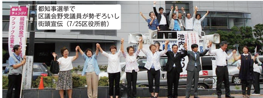
都知事選挙で 区議会野党議員が勢ぞろいし 街頭宣伝 (7/25区役所前)

7月の参議院選挙は、「自公と補完勢力」対「4野党+市民」という対決構図が鮮明となり、野党と市民が力をあわせるかつてない選挙となりました。全国32の1人区すべてで野党統一候補が実現し、福島、沖縄など11の選挙区で勝利したことは、重要です。また激戦の東京では31歳の日本共産党の山添拓弁護士が初当選しました。