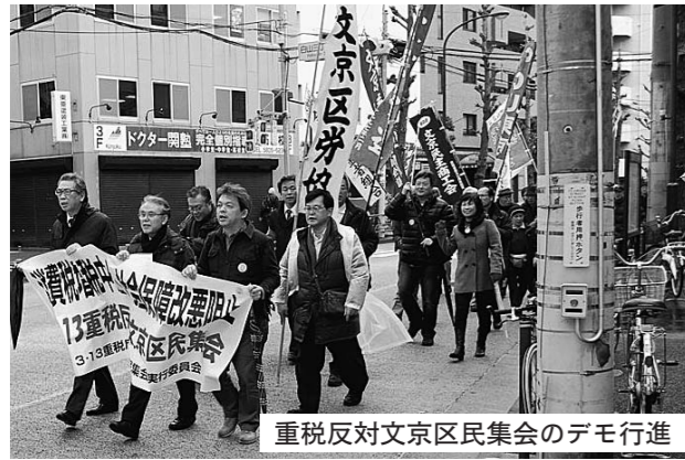
重税反対文京区民集会のデモ行進