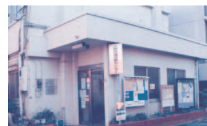
大原地域活動センター

その中で、新たな高齢者や障害者施設は、民間事業者が区と「定期借地権設定契約」を結び、施設を建設、契約期間内において所有と管理運営をするとしています。これまで築き上げてきた福祉のノウハウはどうなるのか、区民の財産は区が責任をもって管理運営すべきです。