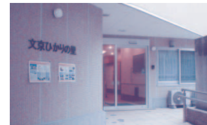
グループホーム「文京ひかりの里」

日本共産党は、都から施設改善の指導を受けている大塚みどりの郷の改修を急ぐ必要があるため、みどりの郷隣地の所有地を活用し、増床も行うよう区に提案、区の決断が求められます。