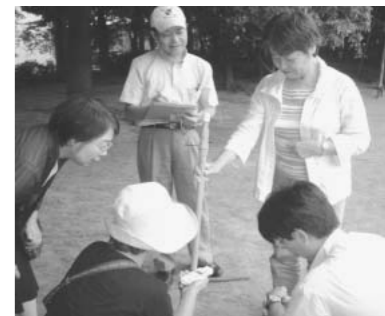
放射線量測定する党区議団

区は5公園、小中学校・幼稚園・保育園校庭、保育園砂場で放射線を測定。区民から駒本・窪町小の砂場が高いとの情報が