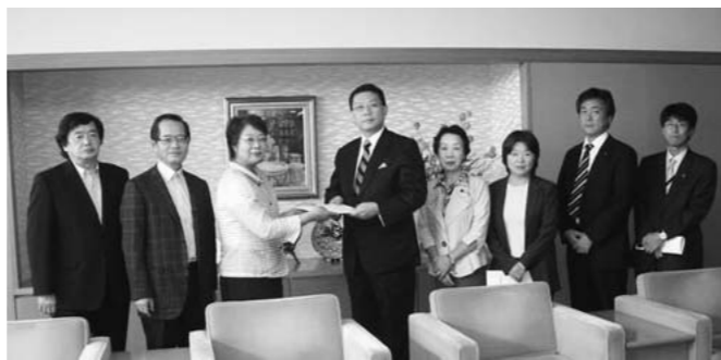
区長に来年度予算要望書を手渡す日本共産党区議団ら

この10年間で、シック建設などの借金を273億円返済し、同時に407億円も新たに貯め込む潤沢ぶり。しかし、区は2010年度の区民税が前年より20億円下回ったことで、「財政難」だと宣伝していますが、とんでもありません。この10年間の平均区民税収入は年間256億円、2010年度は264億円と好調な推移と言えます。