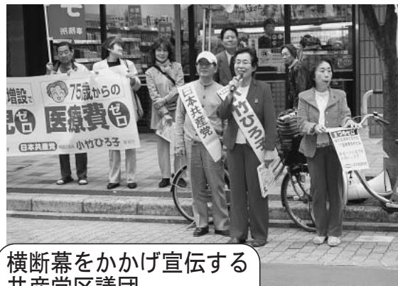
横断幕をかかげ宣伝する 共産党区議団

さっそく他の地方議会では、生活保護の母子加算を復活させる意見書、消費税増税に反対する意見書などが可決される動きがでています。こうした政治の新しい局面を前にすすめるために、日本共産党文京区議団は、がんばります。