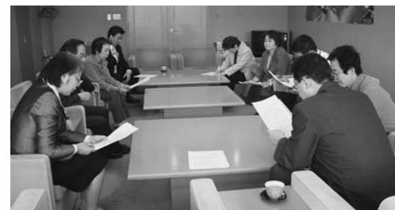
雇用・くらし支援で区長に緊急要望する区議団

文科大臣さえ「図書館になじまない」といい、パブリックコメントでも「導入反対」「慎重に検討」が圧倒的、区民集会でも批判と不安の声が続出です。