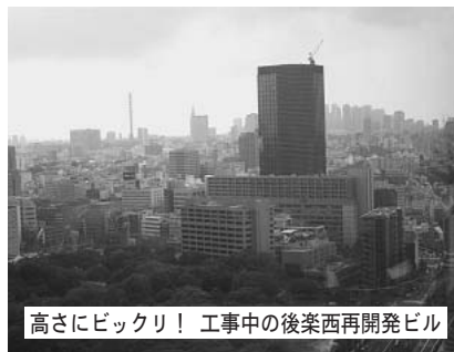
高さにビックリ! 工事中の後楽西再開発ビル

や交通、住環境への影響の見直しなどを求めて反対をしました。また、計画・設計の詳細、全予算計画、税金投入など事業全体を広く区民に知らせ、全区的な説明会を開きパブリックコメントを実施するよう求めています。