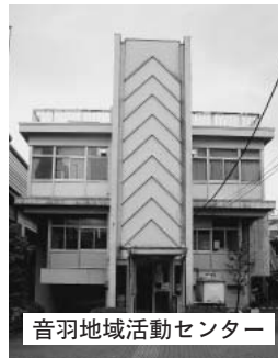
音羽地域活動センター