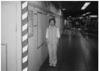
改札階の昇降口（後ろが改札口）

が始まり、東京メトロの説明では工期は11月初旬までですが、完成は当初予定から若干延びるようです。